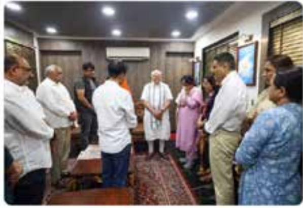
૩:૦૧ PM - Jun 13, 2025 - ૩૩૬.૫K Views

Narendra Modi @narendramodi વિજયભાઈ રૂપાણીના પરિવારજનોને મળી સાંત્વના પાઠવી. વિજયભાઈ આપણો વચ્ચે નથી એ પાત મન માનવા તેવર નથી. ધર્મથી મારે તેમની સાથે નાતો રહ્યો છે. ૩૦૬ કેલબલ પડડાટખનડ સમયમાં બને બને બધા મિલાપીને કમ કર્યું છે. રાજ્ય અને રાજ્યક સ્થાપના વિજયભાઈ ખૂબ મ્યેન્ટુ હતા તથા પસંની વિચારણા પ્રાચે પ્રતિબદ્ધ હતા. એક પાવાના કલંકર તરીકે જહેર જીવનનાં કારકિર્દીની શરુઆત કરી તેમને સંવહનમાં વિવિધ જવાબદારીઓ નિભાવતા નિભાવતા ગુજરાતના મુખ્યમંત્રી બન્યા હતા. Translate post